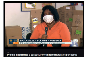
Projeto ajuda mães e conseguem trabalho durante a pandemia

https://globoplay.globo.com/v/8720937/?fbclid=IwAR20-12EKubpygwT3SJK9oPSJB42yH1xw2klvmdBvhpD72f9gIF79ykKV2k